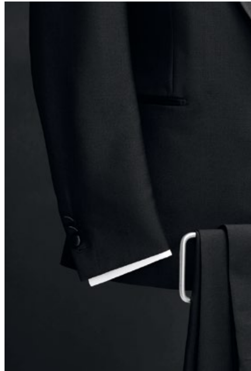
Anzug Vitale Barberis Canonico VB0067, Wool & Mohair, Reversseide S04 Hemd M1018, 170/2, Plisse H002