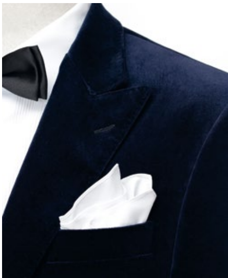
Smoking Brisbane Moss BM0071, Cotton Velvet Futter HW007, Hose VB0067 Hemd M1018, 170/2, Plissee H002