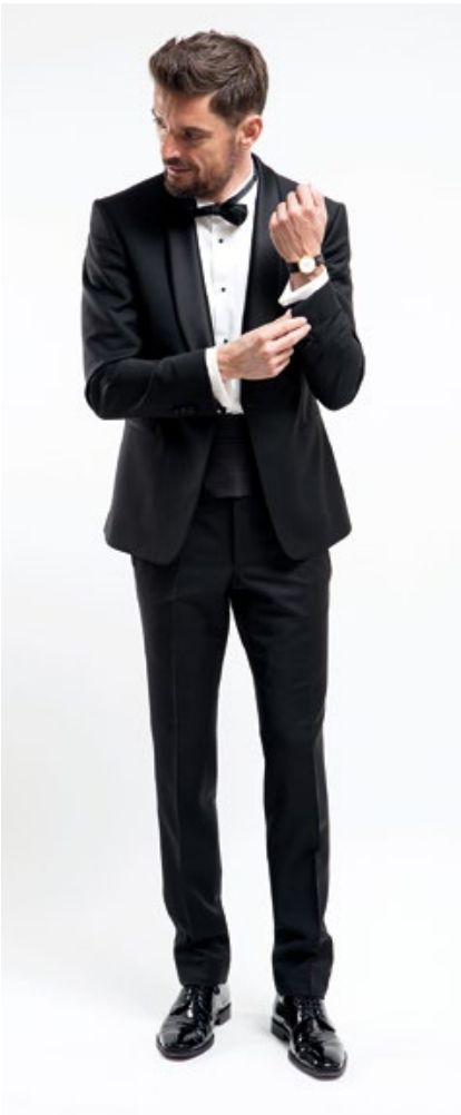
Anzug VB0067, Wool & Mohair, Reversseide S03, Futter 288 Hemd M1018, 170/2, Plissee H003