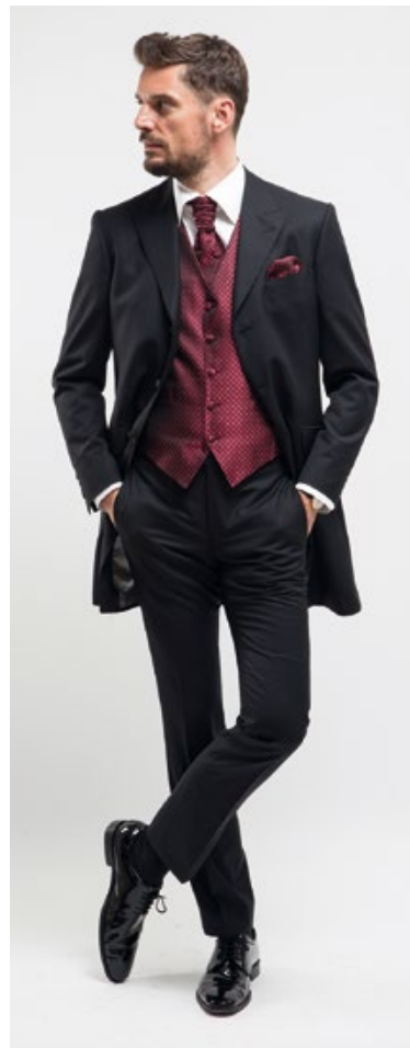
Anzug REDA RE0002 Structure Weste & Accessoires Dutel DU0006, Jacquard