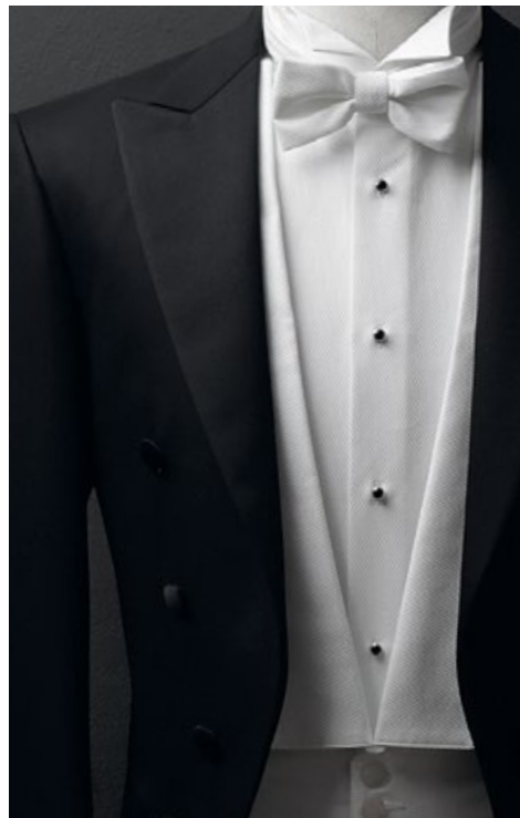
Frack Super 150´S VB0010 Weste & Fliege Marcella H003 Frackhemd Sea Island Poplin M550